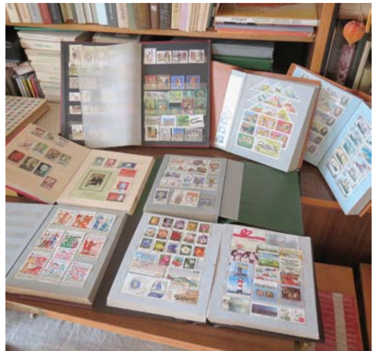
Pašto ženklų kolekcijos surinktos į albumus.