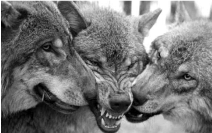
Ankščių rajone sumedžioti trys vilkai.

Šį sezoną buvo leista sumedžioti 120 vilkų. Anykščių rajone medžiotojams pavyko sumedžioti tris vilkus.