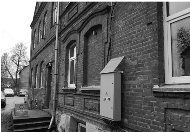
Laikrodžių taisykla veikia Anykščiūose, Vilniaus gatvėje 5-uju numeriu pažymėtame name.